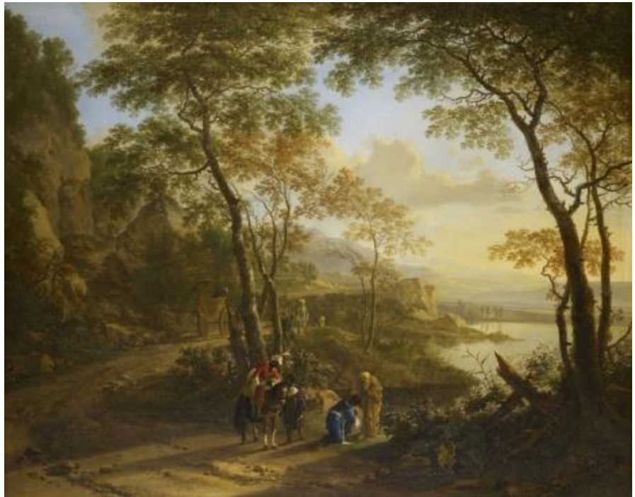
JAN BOTH (1618-1652), Paisatge amb sant Felip batejant l'eunuc