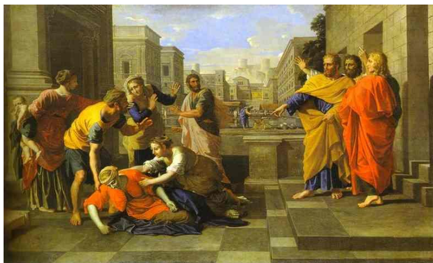
NICOLAS POUSSIN (1594-1665), La mort de Safira