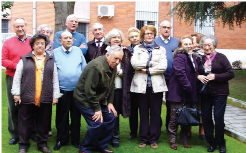
Foto dels participants en la reunió de la Comissió Permanent celebrada a Madrid els dies 22 i 23 de gener per tractar dels temes referents a totes les diòcesis d'Espanya.