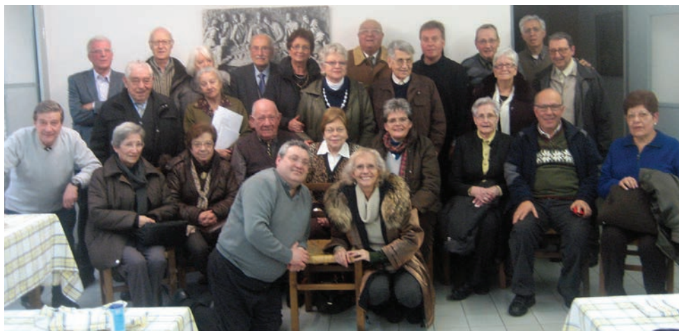
Foto de tots els participants en la 75ena reunió interdiocesana de Vida Creixent, representants de totes les diòcesis de Catalunya, Les Illes i Andorra, per posar en comú les diferents realitats de cadascuna i compartir un dia de germanor i joia.