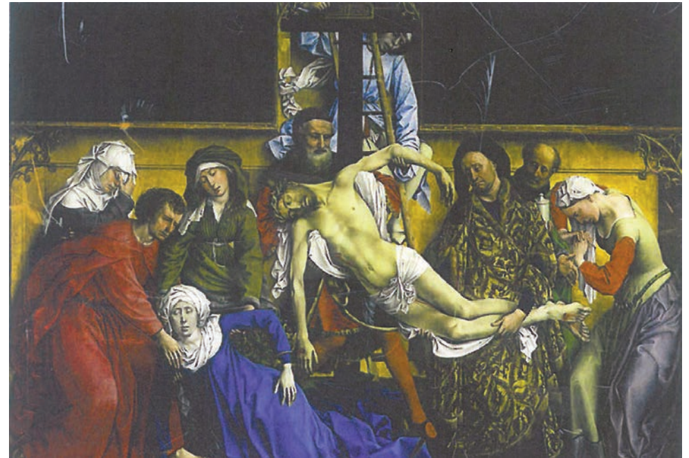
Davallament de la creu del cos de Crist