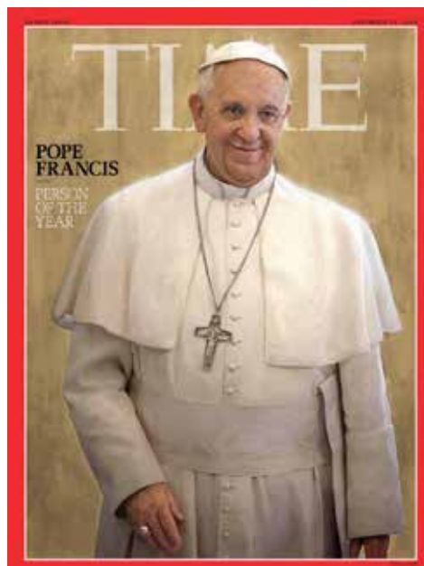
El Papa Francesc, personatge de l'any 2013, a Time.

demanen una renovació en la manera de pensar i actuar dels cristians. Al mateix temps, ha sabut construir una agenda dels grans temes els quals l'Església catòlica ha de donar resposta per tal de ser creïble en les diverses societats d'un món globalitzat. També ha volgut posar ordre dins de l'església a partir d'una meditada política de nomenaments de cardenals i bisbes. Ha sabut identificar el nou rostre misericordiós que ha de tenir l'Església avui i ha senyalat quins són els camins a seguir per situar els cristians en els llocs on cal portar l'amor de Déu. Ha tornat a presentar la Doctrina Social de l'Església, adaptada a les noves