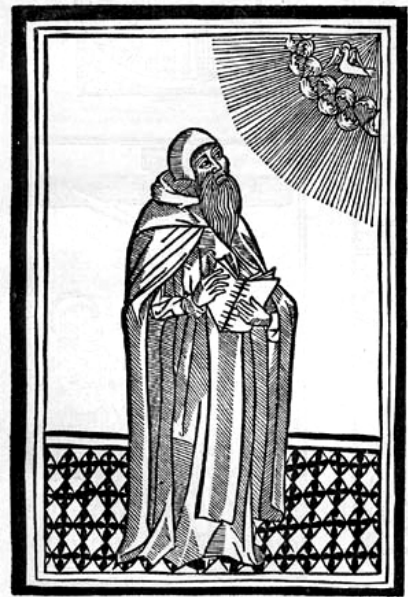
Lull: «APOSTROFIE RAYMUNDI» (Barcelona, 1504)