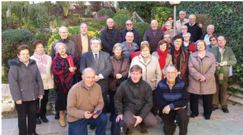
81 a Reunió Interdiocesana del dia 15 de setembre 2015.

Varen participar totes les diòcesis, algun coordinador per motius familiars no va poder estar-hi present i va estar representat per membres de la coordinadora.