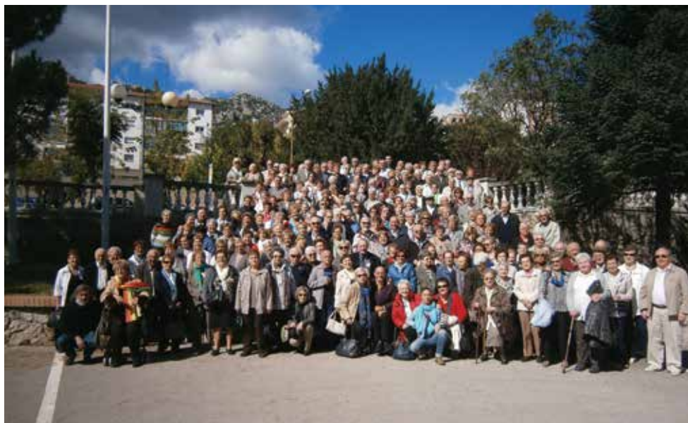
Assistents a l'Assemblea