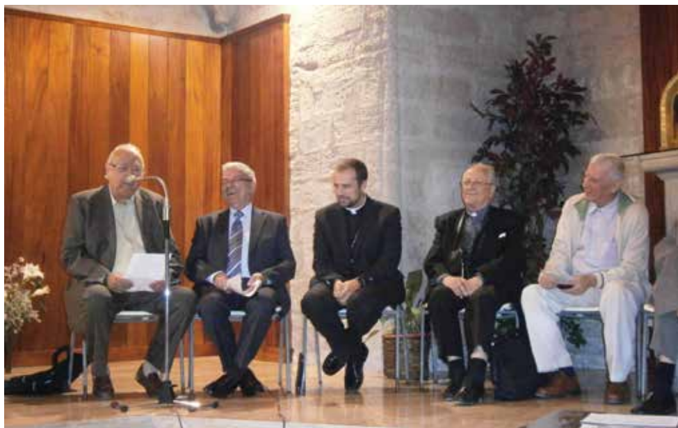
Renovació coordinador diocesà.