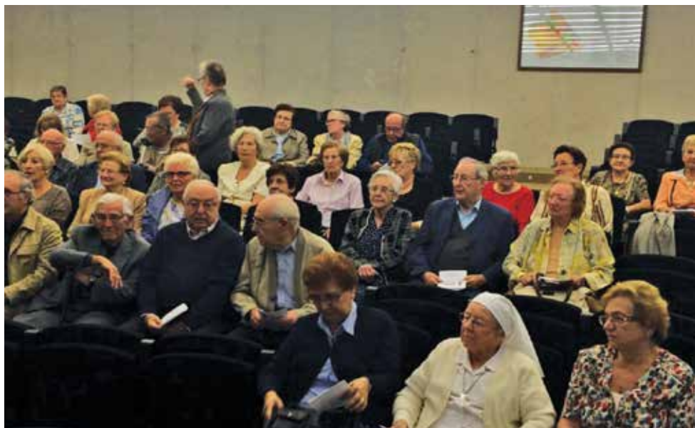
Vista parcial dels assistents a l'Assemblea