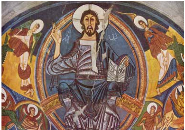
Absis central de Sant Climent de Taüll Mestre de Taüll, 1123 (Museu Nacional d'Art de Catalunya, Barcelona)