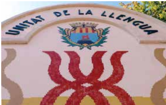
Monument a la unitat de la llengua a l'Alguer.

Serra, Lluís (2014). "El pla (ocult) de la llengua". Article extret del web catalunyareligio.cat a l'enllaç: http://www.catalunyareligio.cat/blog/gerasa/25-09-2014/pla-ocult-llengua-62254