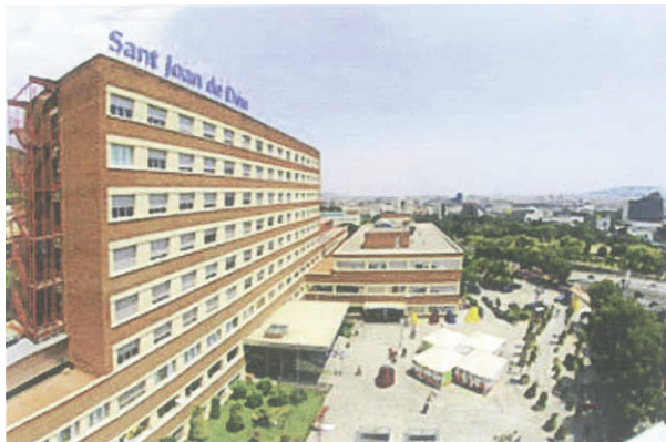
Hospital de Sant Joan de Déu a Barcelona